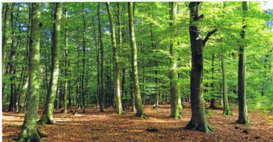
W rezerwacie Buki Mierzei Wiślanej