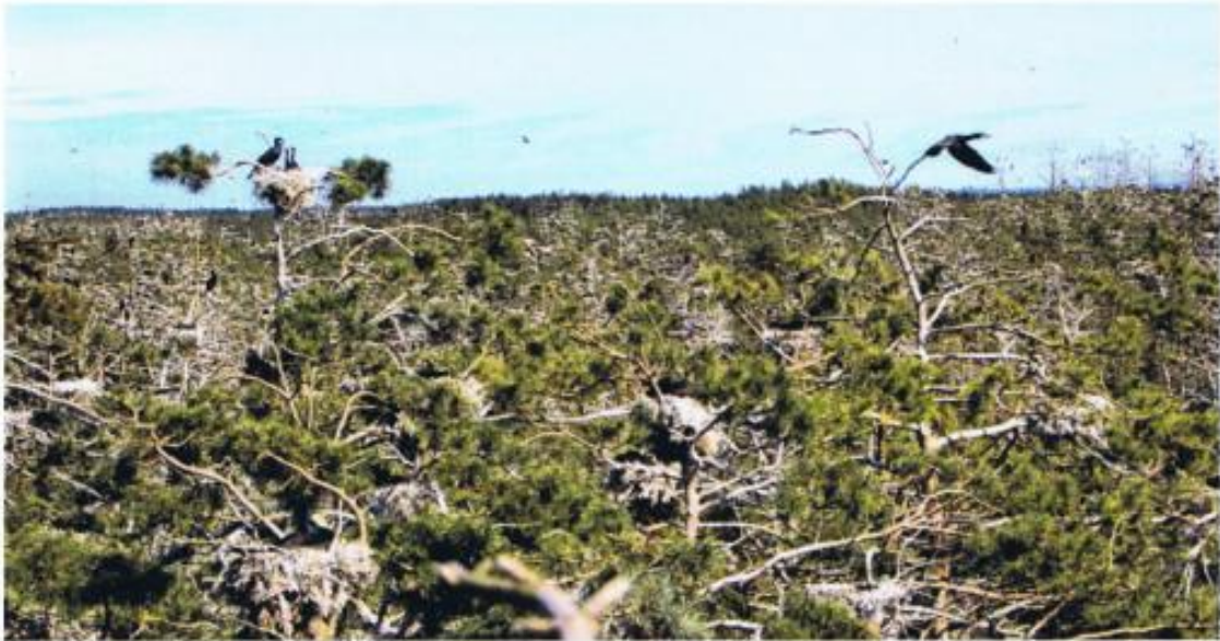
Rezerwat Kąty Rybackie, największe polskie lęgowisko kormoranów

zu zachowały się do dziś m.in: wartownia, budynek, komendantury, garaże i magazyny, część baraków, komora gazowa, krematorium, willa komendanta, budynek psiarni, hale fabryczne, kuchnia obozowa. Szczególnym obiektem związanym z obozem jest Polder Przebrno, usypany rękami więźniów, jedyny dziś obszar łąkowy na Mierzei.