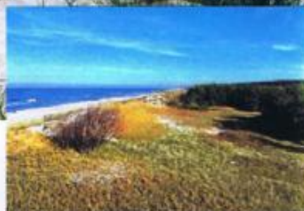
Wydmy w Krynicy Morskiej jesienią

Najważniejszy walor krajobrazowy Parku stanowi wybrzeże mierzejowe ze strefowym układem siedlisk – piękne, piaszczyste plaże, ciągi nadmorskich wydm o dużej dynamice rzeźby, porośniętych w głębi lądu