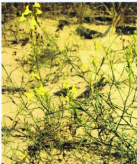
Lonicera maackii - najcenniejszy element flory Parku, fot. Sebastian Nowakowski