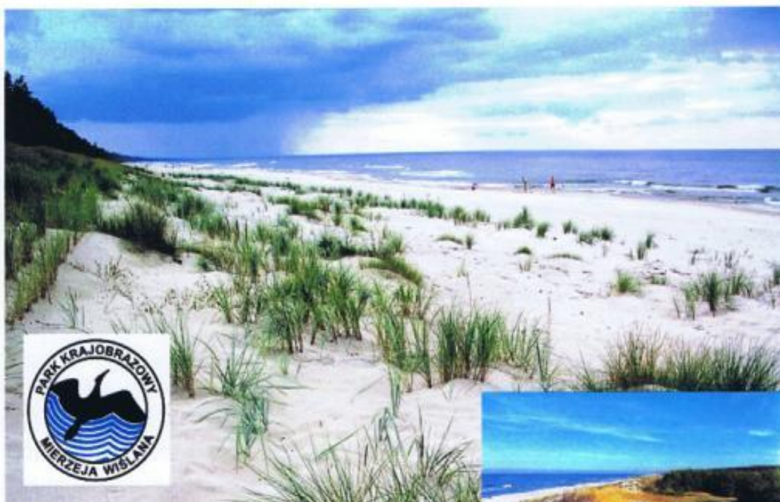
Wydmy w Skowronkach