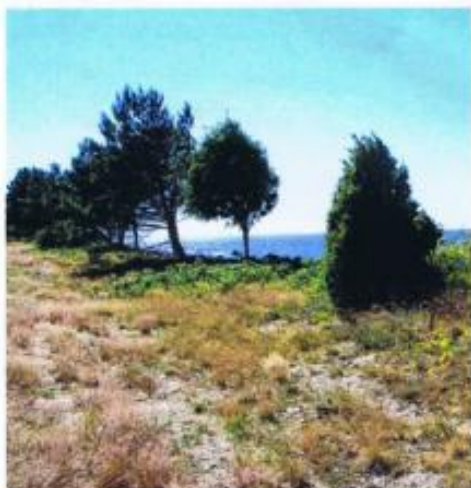
Wydmy w Przeźmierze