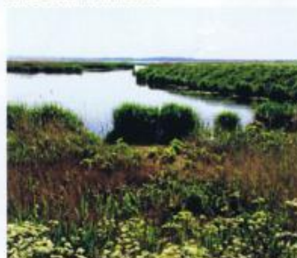
Zatoka Kącka