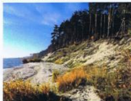
Klif nadzalewowy w Piaskach jesienią