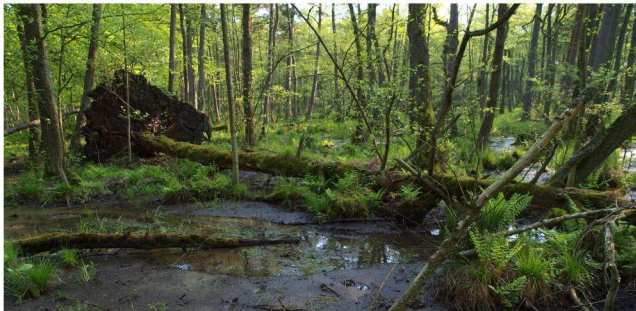
parki krajobrazowe województwa pomorskiego na tle kompleksów leśnych

szczególne walory przyrodnicze, kulturowe, historyczne i krajobrazowe. Te stosunkowo duże powierzchnie dowodzą, że użytkowanie gospodarcze można pogodzić z ochroną przyrody. Wystawa prezentuje: bory chrobotkowe, bażynowe i bagienne, brzezinę bagienną, niżowe buczyny kwaśne, żyzne i storczykowe, łągi źródłiskowe i olszowo-jesionowe oraz grądy. Zwarte kompleksy leśne na terenie województwa pomorskiego stanowią: Bory Tucholskie, Puszcza Kaszubska, Puszcza Słupska, Puszcza Wierchucińska, Puszcza Darłubska, Lasy Łęborskie, Lasy Mirachowskie, Lasy Oliwskie oraz Lasy Iławskie.