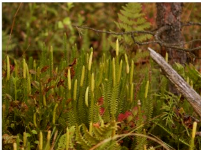
widłak jałowcowaty Lycopodium annotinum

Brzezina bagienna wykształca się w bezodpływowych obniżeniach terenu z wysokim poziomem wód gruntowych, na płytkiej warstwie kwaśnego torfu. Las ten wyróżnia się luźnym drzewostanem, zwykle dwuwarstwowym, z wyraźną dominacją brzozy omszonej, domieszką sosny i świerka (rosnącego poza naturalnym zasięgiem), czasem buka. Warstwa krzewów jest zwarta i składa się głównie z kruszyny oraz podrostu drzew. Runo zielne ma zwarcie do 80%. Brzezina bagienna bywa podobna do bory bagiennego, w którego drzewostanie dominuje brzoza omszona, jednak w runie lasu dominują inne gatunki. Występuje tu borówka czernica, widłak jałowcowaty, siódmaczek leśny i paproć - narecznica szerokolistna. Warstwa mszysta pokrywa do 90% powierzchni, budują ją głównie: rokitnik pospolity, gajnik lśniący, plonnik oraz w niewielkiej ilości torfowce. Brzezina bagienna jest bardzo wrażliwa na zmiany stosunków wodnych i troficznych, podatna na wkraczanie i inwazyjny rozwój obcego siedliskowo i geograficznie świerka.