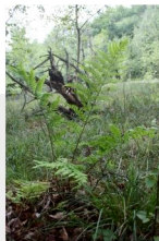
narecznica szerokolistna Dryopteris dilatata