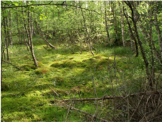
brzezina bagienna w Rezerwie Przyrody "Lewica"

Brzezina bagienna wykształca się w bezodpływowych obniżeniach terenu z wysokim poziomem wód gruntowych, na płytkiej warstwie kwaśnego torfu. Las ten wyróżnia się luźnym drzewostanem, zwykle dwuwarstwowym, z wyraźną dominacją brzozy omszonej, domieszką sosny i świerka (rosnącego poza naturalnym zasięgiem), czasem buka. Warstwa krzewów jest zwarta i składa się głównie z kruszyny oraz podrostu drzew. Runo zielne ma zwarcie do 80%. Brzezina bagienna bywa podobna do bory bagiennego, w którego drzewostanie dominuje brzoza omszona, jednak w runie lasu dominują inne gatunki. Występuje tu borówka czernica, widłak jałowcowaty, siódmaczek leśny i paproć - narecznica szerokolistna. Warstwa mszysta pokrywa do 90% powierzchni, budują ją głównie: rokitnik pospolity, gajnik lśniący, plonnik oraz w niewielkiej ilości torfowce. Brzezina bagienna jest bardzo wrażliwa na zmiany stosunków wodnych i troficznych, podatna na wkraczanie i inwazyjny rozwój obcego siedliskowo i geograficznie świerka.