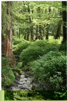
strumień drążący kopułę olsu źródliskowego

Olsy źródliskowe najczęściej objęte są ochroną zachowawczą tzn. bierną. W Parku Krajobrazowym „Dolina Słupi” podjęto próbę ochrony czynnej kopuły olsu źródliskowego w Rezerwacie Przyrody „Źródłiskowe Torfowisko”. Budowa dwóch wzmocnionych zastawek piętrzących ograniczyła erozję złoża torfowego poprzez spowolnienie spływu powierzchniowego wód z kopuły.