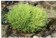
krótkosz strumieniowy Brachythecium rivulare