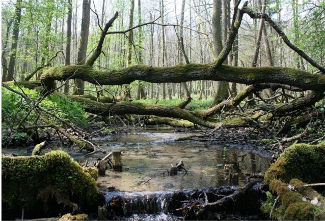
zastawka spowalniająca odpływ wody z Rezerwatu Przyrody "Źródłiskowe Torfowisko"

Olsy źródliskowe najczęściej objęte są ochroną zachowawczą tzn. bierną. W Parku Krajobrazowym „Dolina Słupi” podjęto próbę ochrony czynnej kopuły olsu źródliskowego w Rezerwacie Przyrody „Źródłiskowe Torfowisko”. Budowa dwóch wzmocnionych zastawek piętrzących ograniczyła erozję złoża torfowego poprzez spowolnienie spływu powierzchniowego wód z kopuły.