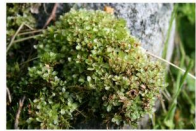
merzyk kropkowany Rhizomnium punctatum

W licznie spływających z kopuły olszyny źródliskowej strumykach na kamieniach, gałęziach czy na samym torfie w najniższej warstwie - mszystej można spotkać rzadkie gatunki mszaków źródliskowych i wątrobowców.