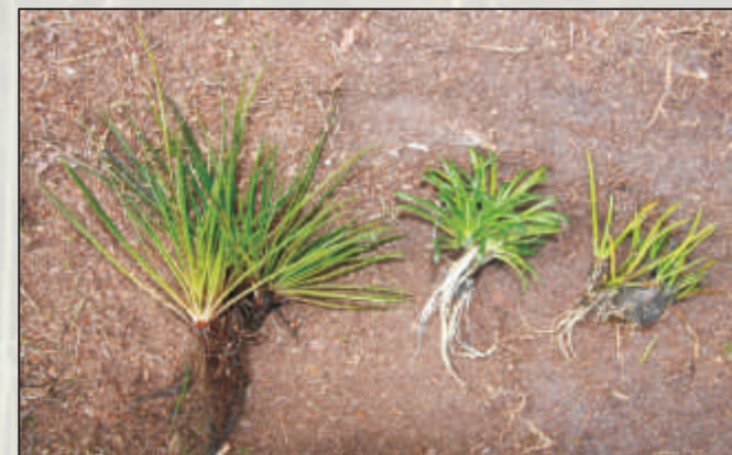
Poryblin jeziorny, lobelia jeziorna i brzeźca jednokwiatowa.

z małą zawartością wapnia. Rośnie na dnie piaszczystym, pokrytym warstwą humusu, na głębokości od 0,1 do 2 m w małym zagęszczeniu, nie przekraczającym 5 osobników na 1 m 2 . W Polsce stwierdzono go jedynie na ośmiu stanowiskach, z których dwa (jeziora Jelenie Duże i Małe) występują w otulinie Parku Krajobrazowego „Dolina Słupi”.