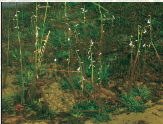
Kwitnąca od czerwca do sierpnia lobelia w miejscach liczego występowania tworzy białe łany okalające linię brzegową

Obok lobelii roślinami wskaźnikowymi jezior lobeliowych są brzeźca jednokwiatowa oraz poryblin jeziorny i kolczasty.