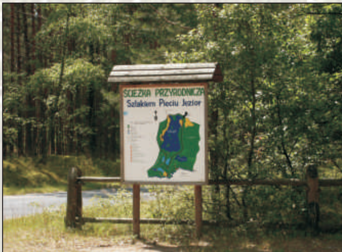
Tablica z opisem i mapą ścieżki przyrodniczej wokół jezior lobeliowych obok Jasienia.

Na obszarze Parku Krajobrazowego „Dolina Słupi” zinwentaryzowano dotychczas 10 jezior lobeliowych. Wszystkie leżą w południowo-wschodniej jego części. Najcenniejsze i najlepiej zachowane jeziora to: Modre (Łupalickie, Błękitne), Obrowo Małe i Pomyskie (Dworcove), leżące na południe od jez. Jasień. Wszystkie zachowały zwarte zespoły roślinności reliktywnej z lobelią, brzeżycą i poryblinem. Zlewnie ich porastają bory sosnowe i mieszane. Tę grupę jezior planuje się objąć ochroną rezerwatową, utworzono tam specjalny obszar ochrony siedlisk „Jeziora lobeliowe koło Soszycy” europejskiej sieci Natura 2000. Aby przybliżyć ich walory wyznaczono w okolicy ścieżkę przyrodniczą.