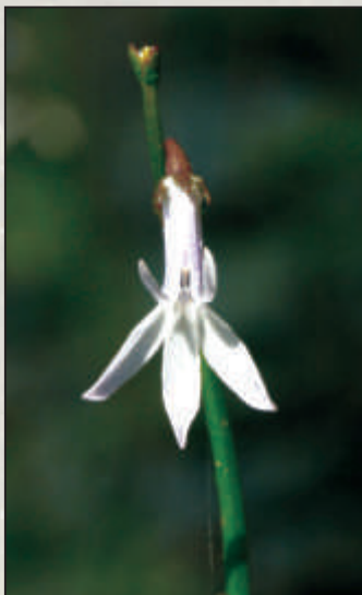
Drobne kwiaty lobelii nasz wieszcz porównał do białych motyli.

Lobelia zachowała się w nielicznych - niewiele zmienionych od czasu swojego powstania - jeziorach, żyjących obok lobelii także inne reliktywne gatunki flory. Jeziora te są przeważnie miękowodne i kwaśne, przez to oligotroficzne (skąpożyźne). Ich woda jest zwykle bardzo czysta, dno piaszczyste, niekiedy usłane kożuchem torfowców. Przeważnie są to zbiorniki małe, śródleśne, otoczone borami sosnowymi, dąbrowami lub buczynami. W Polsce jest ponad 7000 jezior, jednakże lobeliowych jedynie nieco ponad 150. Poza Skandynawią i Szkocją tworzą one u nas jedno z największych skupisk w Europie.