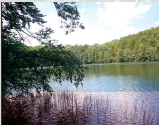
Zagubione w leśnych ostępach niewielkie jeziora skutecznie opierają się działaniu czasu i człowieka, chroniąc w swych wodach reliktywną florę.