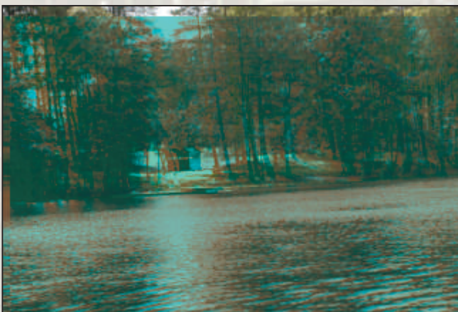
Kąpiący się przy brzegu ludzie niszczą rosnącą tam roślinność.

Mogą one jednak ulec wielkiemu przyspieszeniu na skutek działalności człowieka. Jeziora lobeliowe są na takie procesy szczególnie wrażliwe. Tracą swoją specyfikę, giną z powodu odlesienia zlewni, lokalizowania w niej zabudowy lotniskowej, z powodu nawożenia pól uprawnych, wpuszczania wód ze zmeliorowanych lasów bagiennych i torfowisk, a także zniszczeń powodowanych przez gospodarkę rybacką i kąpiących się ludzi.