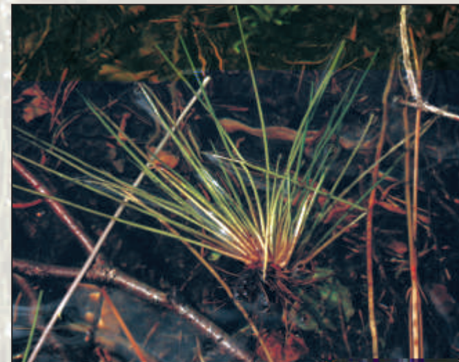
Poryblin jeziorny źle znosi falowanie wody.

Poryblin kolczasty występuje w jeziorach kwaśnych ze sporą koncentracją związków humusowych. Lubi wody