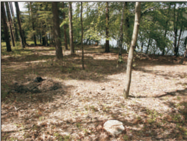
Wycianie lasów przyległych do jezior jest jednym z powodów wymierania reliktywnej roślinności.

Jeziora lobeliowe, jak wszystkie inne, podlegają procesowi starzenia się. Na skutek dopływu ze zlewni substancji odżywczych wzrasta ich trofia. Na Pomorzu często do wód jezior dostają się substancje humusowe, powodujące stopniowe ich zakwaszenie i dystrofizację wód. Te naturalne procesy zachodzą bardzo powoli.