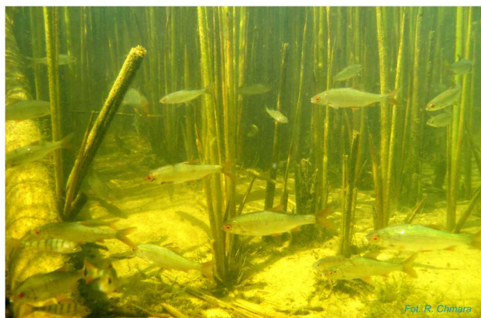
Ławica płoci w pasie szuwarów