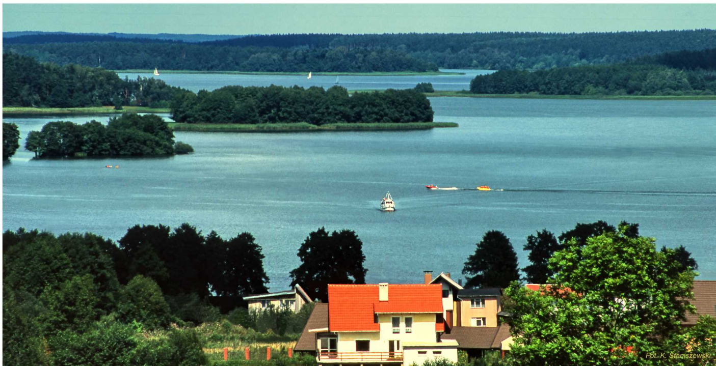
Widok z Charzyków na południową część jeziora z Wyspą Miłości