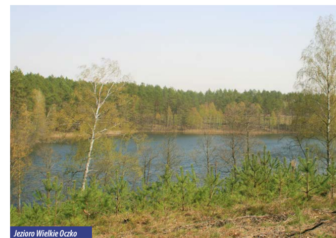
Jezioro Wielkie Oczko