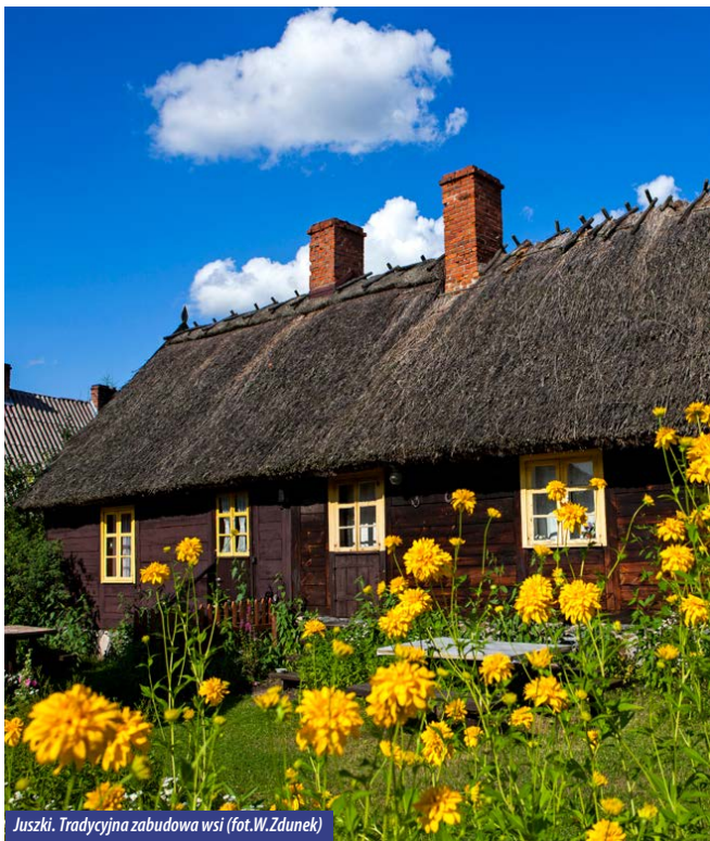
Juszki. Tradycyjna zabudowa wsi

Zabudowa jak i zespół ruralistyczny wsi Juszki charakteryzuje się wybitnymi wartościami kulturowymi, które przyczyniły się do wpisania miejscowości do rejestru zabytków nieruchomości województwa pomorskiego. Zobaczmy tu liczne przykłady tradycyjnej regionalnej zabudowy Kaszub Południowych. Historia Juszek sięga XIII w – w 1217 r. Mściwuj I zapisał wieś cystersom oliwskim. Jeszcze wcześniej datuje Juszki znaleziony tu skarb monet rzymskich z I w. n.e. Pochodzenie nazwy wsi tłumaczy lustracja z 1664r., w której wymienia się pięć smolne: „jeden grzybowski i drugi u Uszka”. Ze względu na nieurodzajne piaszczyste ziemie otaczające Juszki, wieś była niegdyś jedną z najbiedniejszych w powiecie, a ludowe porzekadło mówiło „Biedni jak kozy w Juszkach”.