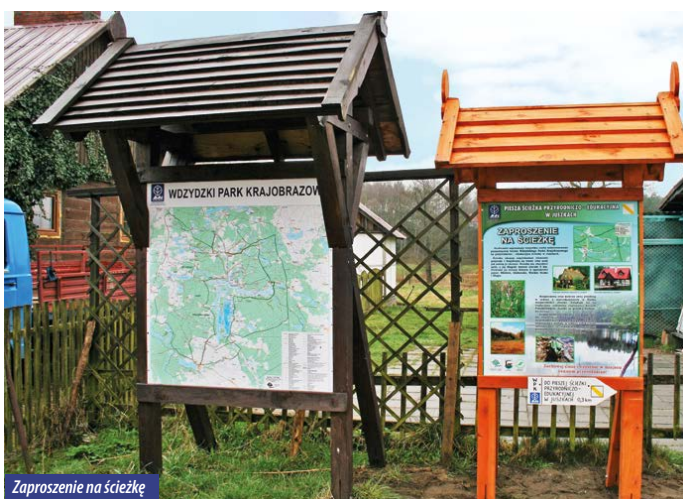
Zaproszenie na ścieżkę