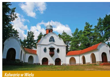
Kalwaria w Wiela

Ponownie nad jezioro zjeżdżamy koło przystani dla kajakarzy. To znane miejsce odpoczynku również dla żeglarzy i rowerzystów. Stąd prowadzi półkilometrowa ścieżka do punktu widokowego na jezioro. Dalej szlak kieruje nas do Przytarni, a stamtąd do Wiela – znanej wsi letniskowej z licznymi atrakcjami turystycznymi, zabytkami i przejawami kultury kaszubskiej, w tym położona na wzgórzach nad jeziorem Wielewskim Kalwaria z Sanktuarium Męki Pańskiej. Z Wiela trasa rowerowa prowadzi na wschód do rzeki Wdy, którą przekraczamy w miejscu rozrządu jej wód na rzekę i kanał. Kanał czarnowodzki o długości 24 km został wykopany w połowie XIX w. w celu nawadniania nieuro-