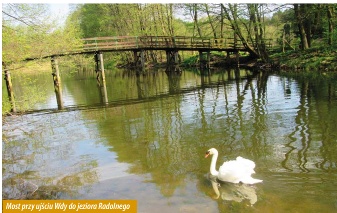
Most przy ujściu Wdy do jeziora Radolnego

Z Wąglikowic wyruszamy na południe, do Czarliny, stamtąd przejeżdżamy przez nieistniejący już folwark Przerębską Hutę i kolejno przez Rów, Wygodę, Joniny Małe, wieś Przytarnię, Wiele, Górki, Abisynię Górską, Borsk, Wdzydze Tucholskie, Lipę, Zabrody, Gołun i Juszki - skąd wracamy do Wąglikowic. W ten sposób tworzy się pętla otaczająca cały Kompleks Jezior Wdzydzkich – Wdzydze, Radolne, Gołun i Jelenie. Na trasie czeka wiele ciekawostek przyrodniczych i krajobrazowych. W pobliżu Czarliny znajduje się też okazały dąb, jeden z wielu pomników przyrody na terenie Parku. Z Czarliny kierujemy się na zachód i przekraczamy rzekę Wdę w miejscu, gdzie uchodzi ona do jeziora Radolnego. Kolejnym ciekawym przystankiem jest eutroficzne, zarastające jezioro Zatur, które