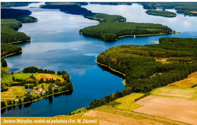
Jezioro Wdzydze, widok od południa

nad jeziorem Gołuiń, znajduje się kompleks torfowisk „Kruszyńskie Błoto”, zwane też Głuche. Tu również ustanowiono użytek ekologiczny dla ochrony tych ekosystemów – „Torfowisko nad jeziorem Gołuiń”.