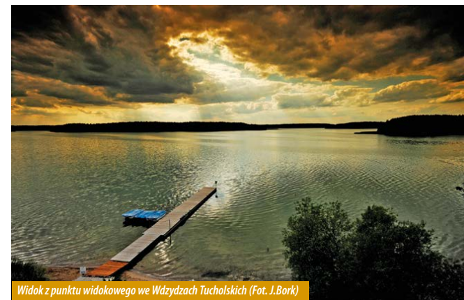
Widok z punktu widokowego we Wdzydzach Tucholskich