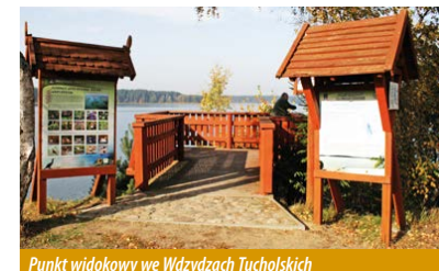
Punkt widokowy we Wdzydzach Tucholskich

Następnie kierujemy się dalej na północ wzdłuż brzegu, mijamy półwysp Lipa i docieramy na półwysp Zabrody. Tu znajduje się torfowiskowy użytek ekologiczny o tej samej nazwie. Zmieniamy charakter krajobrazu i ponownie wjeżdżamy głębiej w lasy. W niedalekiej odległości od szlaku mijamy po prawej stronie dystroficzne oczka wodne z płatami torfowisk, objęte ochroną prawną w formie użytków ekologicznych – „Modrzewnicowy Mszar” i „Żurawinowe Bagno”. Po lewej stronie,